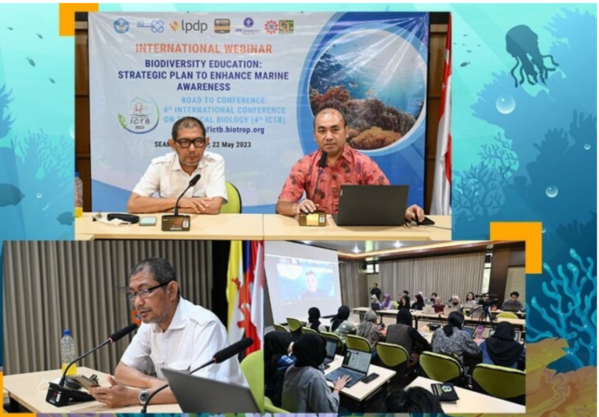
Webinar pentingnya biodiversitas skala internasional.

MEDIABOGOR.CO , BOGOR- SEAMEO BIOTROP dan IPB University telah menyelenggarakan rangkaian kegiatan webinar untuk meningkatkan kesadaran dan pemahaman tentang pentingnya biodiversitas.